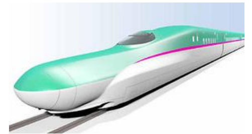
次回は検査周期延伸も提案？

一要求で出された内容についても今後は統括本部で対応することになります。まだ動きが鈍い新幹線統括本部ですが、新幹線に特化したやり取りが行われることから、これまでよりも対応が早くなることを要請し、交渉が終了しています。