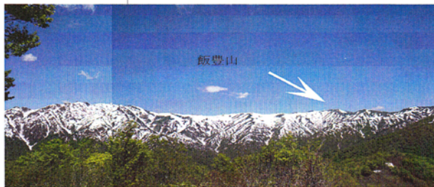
(大日岳、御西岳、飯豊本山)

飯豊連峰は新潟、山 形、福島の三県にまた がる大きな山塊である が、その南端の一角に ある鏡山は、飯豊連峰 の好展望台として知ら れている。鏡山山頂から の展望の良さ では数ある山々の中 でも随一ともいわ れるほどである。「鏡 山」という山 名は、頂上から見た 飯豊本山と大日岳 が、実川を挟んで映 鏡のように見える ことに由来するとい う。