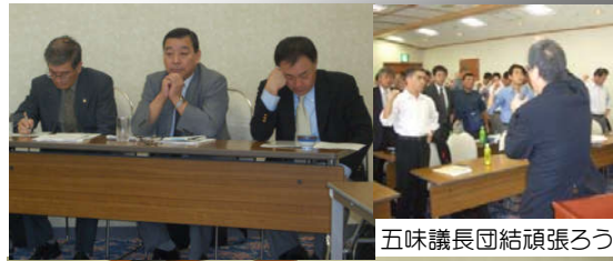
五味議長団結頑張りろ