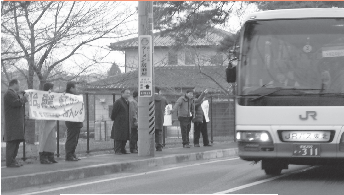
東日本入社式でのアピール行動 (新白河研修センター)