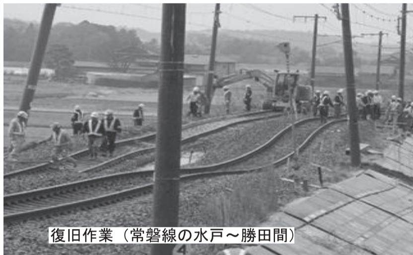
復旧作業（常磐線の水戸～勝田間）

家や家族を失った者も多数出ています。現在、確認出来ている状況は、水戸線は鉄橋が崩落しています。水郡線は線路が陥没し、ぐにやぐにやになっていて復旧に相当日数がかかるのではとの状態です。設備も相当破壊され、水戸駅はホームが崩れ、勝田駅は駅舎の天井が落