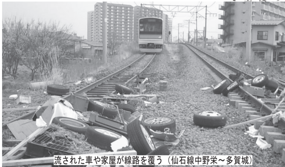
流された車や家屋が線路を覆う（仙石線中野栄～多賀城）

合員全員の安否を確認した。しかし、家族の犠牲や家屋の流失も報告されている。また、未だ家族と連絡が取れない組合員もいる。 仙台地本が入る「こくろう会館」内部も震災による被害が大きく、19日に機関としての機能を回復したが、通信機能の破損により100%の復旧とはなっていない。 当面、被害状況報告の集中と被災者の救援、勤務や復旧にむけた支社への対応など復旧に向け全力をあげていく。