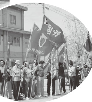
被災地宮古でも元気に開催 (宮古駅前広場)