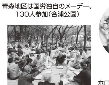
青森地区は国労独自のメーデー、130人参加(合浦公園)