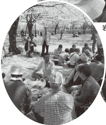
デモ行進を終わり 盛岡地区も花見酒80人