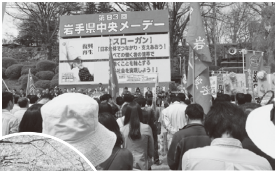
岩手県中央メーデーでは、復興再生が強く訴えられた(岩手公園)