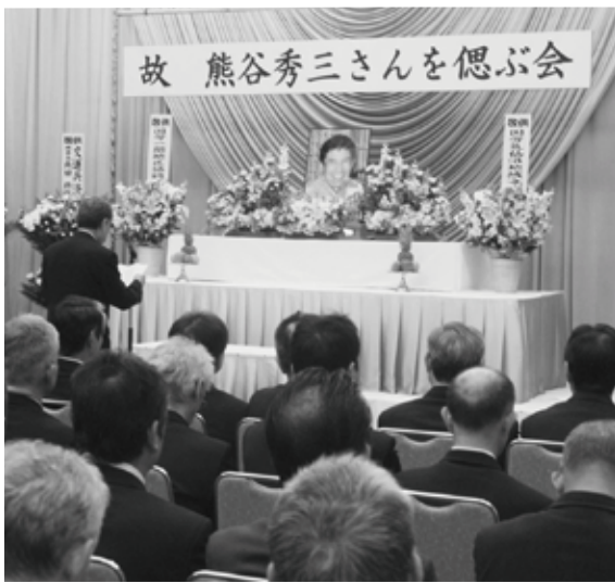
=多くの仲間、関係者が参加した偲ぶ会=