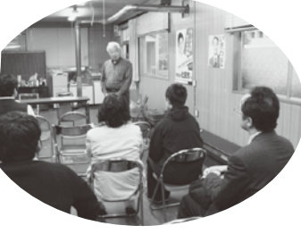
一戸地区ではこじんまりと開催 (地区労事務所)