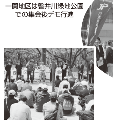
一関地区は磐井川緑地公園での集会後デモ行進