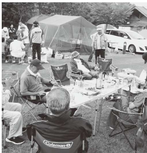
夜遅く(?)まで続いた交流

この集会の数カ月前から毎週金曜日、首相官邸前や東京電力会社前での市民抗議集会が続いています。一部マスコミは、官邸でも脱原発デモや抗議集会を「無視できない状況にある」と報じています。しかしながら関西電力・政府は夏場の消費電力が現行の火力・水力発電では確保できないとの試算と、安全性には問