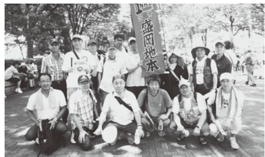
〈国労関係者で記念撮影〉

この夏関東で初の猛暑日を記録した7月16日東京・代々木公園で開催された「さようなら原発・10万人集会」に参加してきました。熊谷市で37・