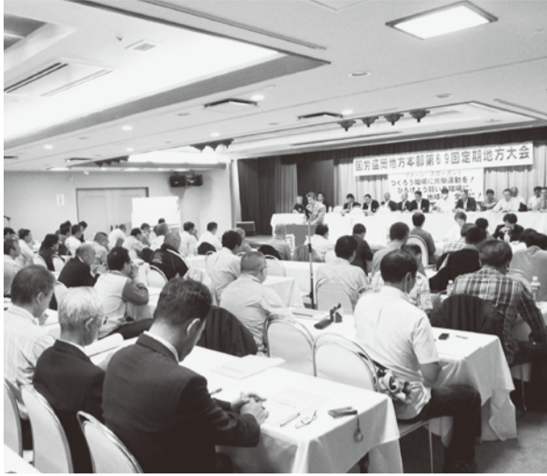
=大会会場の盛岡市つなぎ温泉・愛真館=

地方本部は、第69回定期地方大会を10月11日・12日の両日盛岡市・つなぎ温泉「愛真館」で関係者約90人が参加の中で開催した。方針討論では、職場の厳しい労働実態、安全・安定輸送、岩泉線、震災被災地線区の復旧問題、組織拡大の取り組みなどで14人が発言し議論が行われた。