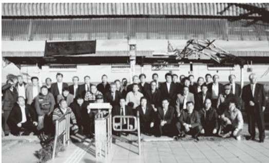
被災した富岡駅で記念の撮影

11月22日、23日日本本部主催の国労「フクシマ」交流学習会(46人参加)に参加しました。1日目全国から参加した組合員と郡山駅前からJRバスで被災地に向かい出陣しました。元自動車分会の組合員が自らの被災した体験を話しながら現視察の道案内をしてくださいました。視察の中で一番心に