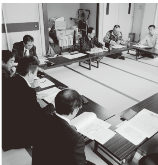
＝膝を交えて議論する参加者＝

新幹線に接続ができず問題になっている。最近では国労にも見習いを付けているが自分ケガをしない、周りにもケガをさせない、仕事のミスはその場で終わらせ、後に引きずらないよう指導している。職場のレクに出来るだけ参加し、若手と話をするように、また