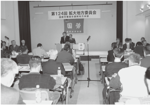
意思統一を図った拡大地方委員会・リリオ会議室

地方本部は、第124回拡大地方委員会を2月23日に盛岡市のリリオで委員・特別委員・分会代表・地方本部役員ら約60人が参加する中で開催した。