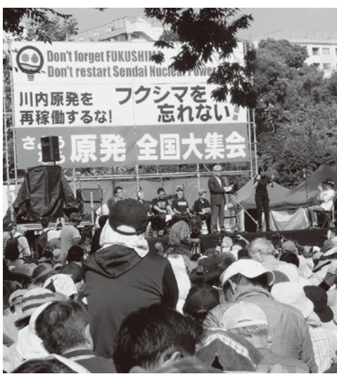
「呼びかけ人のトークで訴えた」

映画「標的の村」は沖縄本土北部の東村(ひがしそん)高江区を取り囲むように米軍のヘリパッドが整備され、住民は常に訓練の「標的」になっていた。普天間基地でオスプレイの配備に反対する住民たちの活動を記