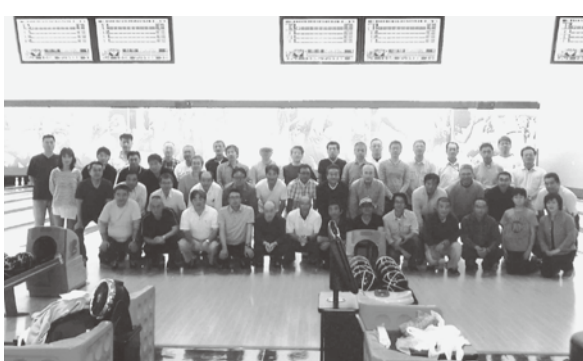
参加者全員の記念写真後、プレーへ

第3回地方本部ボウリング大会が9月27日14時30分からラウンドワンスタジアム盛岡店で開催された。今年は12チーム48人(家族3人、うち子ども1人)が参加、14時から簡単な開会式と説明を行い、1チーム4人で2ゲーム合計点での団体戦及び個人の競技に入った。競技は、12レインに分かれ、3分間の練習後に開始され、和気あいあいの中、団体・個人の優勝目指し、華麗なフォーラム?日頃の練習の成果?実力以上のスコア?を目指し競った。4時にはゲームを終わる団体・個人3位までの表彰などを行い終了した。