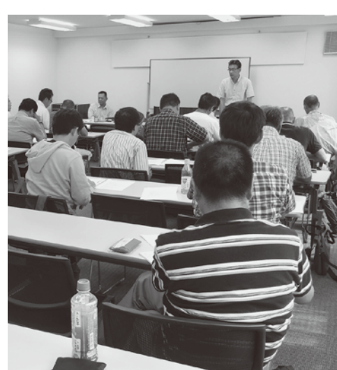
＝東北3地本7分会からの参加者＝