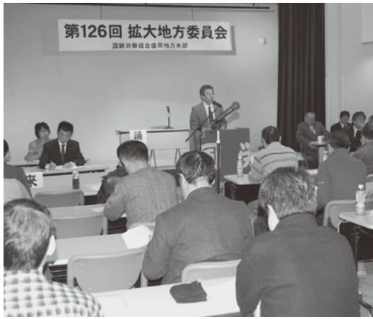
＝拡大委員会の行われたリリオ会議室＝

拡大キャッチコピー 「新しい仲間づくりを皆の力で」 「一緒に解消しませんか、あなたの疑問。あなたに疑問。加入ってます」