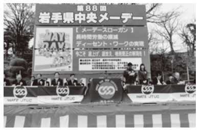
＝岩手県中央メーデー・盛岡城跡公園＝