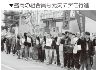
▼盛岡の組合員も元気にデモ行進