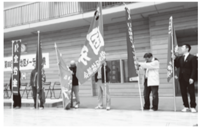
▲国労も旗を掲げ参加・一関(13人参加)