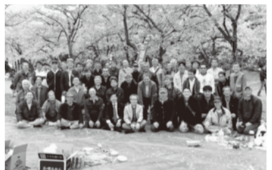
▲今年は公園で飲む前に50人がしゃきつとして記念撮影・盛岡