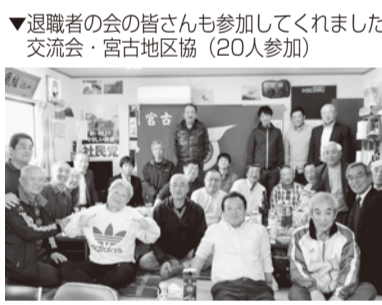
▼退職者の会の皆さんも参加してくれました交流会・宮古地区協(20人参加)