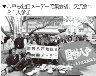
▼八戸も独自メーデーで集会后、交流会へ21人参加