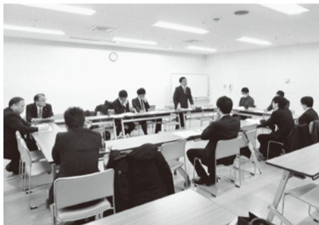
◇意見交流する青年部員◇

4月1日、大宮市・ソニックシティ前で行われた「入社式宣伝行動」をはじめとした各種行動に参加し、初めて東日本本部青年部の活動に参加することができました。今回の活動では青年部員全員と