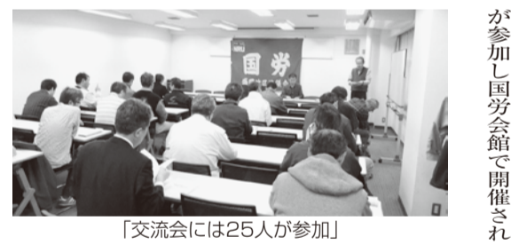
「交流会には25人が参加」

この後、福井・新潟・福島の各地からの報告がおこなわれ、全国の原発を廃止に追い込む集会アピールが採択され、デモ行進に入った。全くくめど立たない福島第1原発の事故処理やもんじゅの廃炉に、これからも莫大な費用が予想され国民負担は増え続けるばかりだ。原子力政策の転換とすべての原発の廃止を目指し我々も最後まで闘い抜こう。