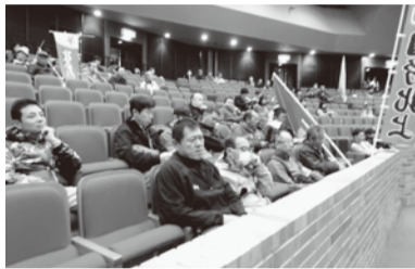
▼今年は花巻市民会館で行われた花巻北上和賀メーデー(15人参加)