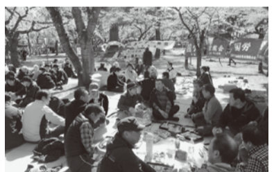
▲青森地区独自メーデー集会后、交流会へ103人の参加で開催し団結花見会へ・青森合浦公園