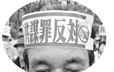
▲ゼットイ反対をゼッケンとこれで訴えた・盛岡