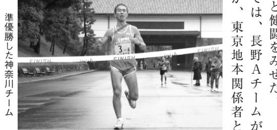
準優勝した神奈川チーム