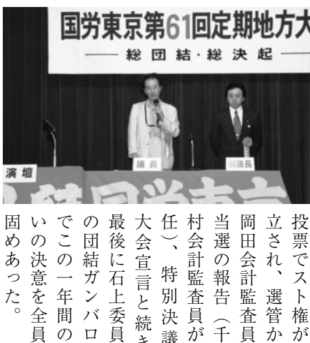
国労東京第61回定期地方大会 —総団結・総決起— 演壇

明党が中心軸となった政治的解決案が作りだされました。この闘いを支えてこられたのは、職場・地域における組合員・家族のたゆまぬ努力と、闘争団とその家族を物心両面から支えるカンパ等を継続していただいた地域・共闘の仲間皆さんの存在です。残された課題の最終解決を目指し組織に集中し、全組合員・家族が結集することを訴えます。 安全・安定輸送の確立は、労使の枠を超えて日常的に検証し、改善されなければならぬ課題であります。とりわけJR東日本においては「首都圏輸送障害低減に向けた対策」を実施。事故・故障件数は減少しているものの、一度発生すると輸送障害が拡大するなど、深刻な状況に陥っています。あわせて過去二年間で六名もの尊い命が痛ましい労災事故で奪われるなど、「安