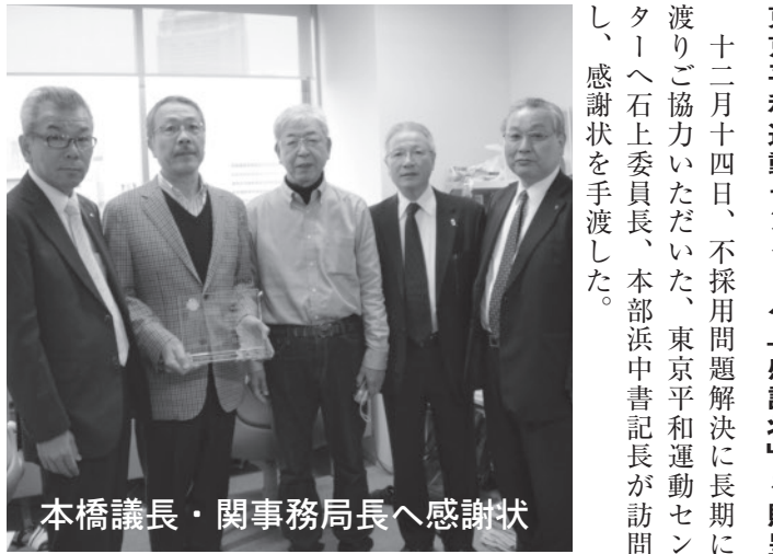
本橋議長・関事務局長へ感謝状