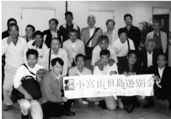
盛んに開催された退職組合員の送別会

組織問題では、組合員の平均年齢が五四歳を超えるなかで、組織拡大は大変に難しい問題ですが、日常的に会話に取り組み、仕事の面でも技術・技能の継承という大きな事だけでなく、一緒に仕事をし若し人たちに仕事を覚えてもらい、またその中からお互いの信頼関係を築きながら、組織拡大に向けた取り組みを強めたいと考えています。