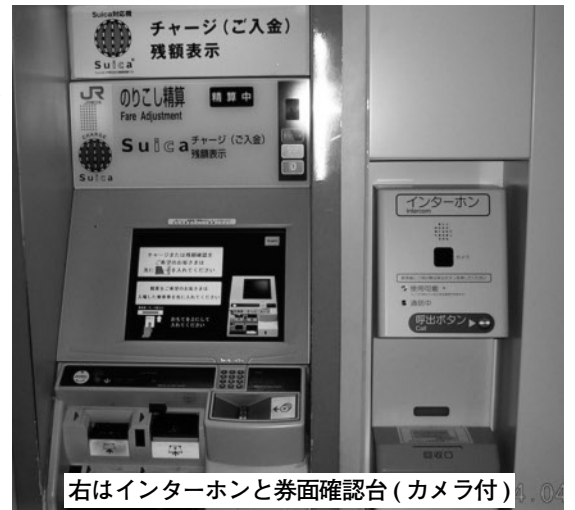
右はインターホンと券面確認台（カメラ付）