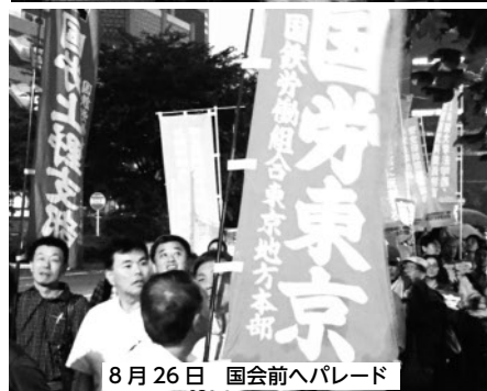
8月26日 国会前パレード

きないほどの状況となった。集会では、民主・市民・共産・生活の野党党首や坂本龍一さんもスピーチに立ち、安保法案反対を訴えた。この日は、全国各地で同様な取り組みが行われ、ネットを介して反戦の心がつながった人たちが、全国で結集し、戦争反対を訴えた。