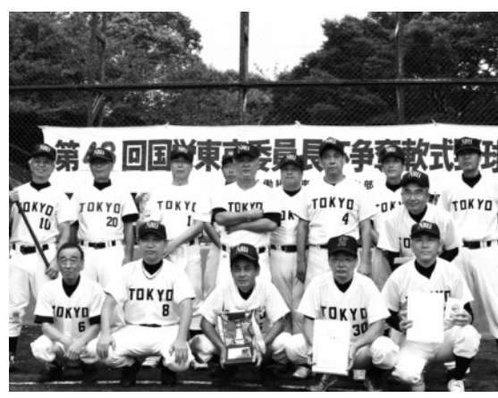
優勝 新橋A(東京駅)チーム

準決勝・決勝は猛暑も落ち着いた九月三日に行われ、準決勝は大宮B対新橋B(品川信号)と新橋A対八王子Aの組み