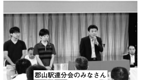
郡山駅連分会のみなさん