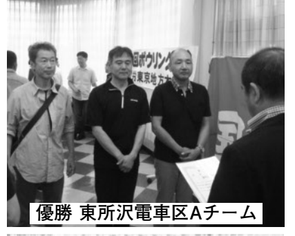
優勝 東所沢電車区Aチーム