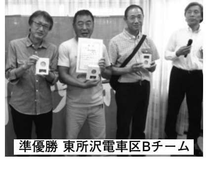
準優勝 東所沢電車区Bチーム