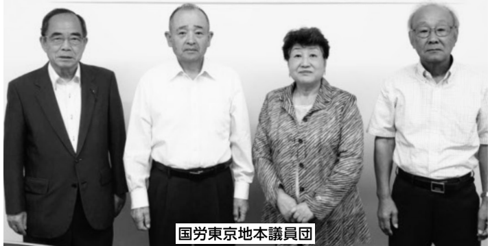
国労東京地本議員団