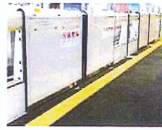
○戸袋移動型ホーム柵