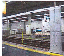
○昇降ロープ式ホームドア