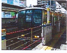
○昇降ロープ式ホーム柵(支柱伸縮型)