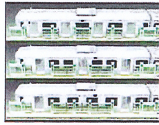
○マルチドア対応ホームドア