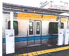
○昇降パー式ホーム柵