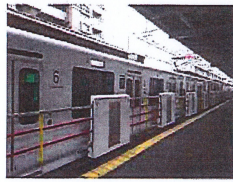
○軽量型ホームドア