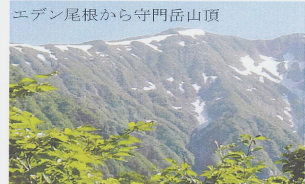
エデン尾根から守門岳山頂

マガヤの草原) 雪溪になっていた。ここからの先は、尾根道に途中雪溪になっている箇所もあり。モガキながら1時間ほどで山頂に到着。山頂には4人ぐらいの人が居ました。ここで休憩し同じ道へ下った。