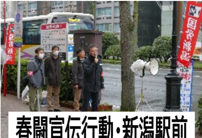
春闘宣伝行動・新潟駅前