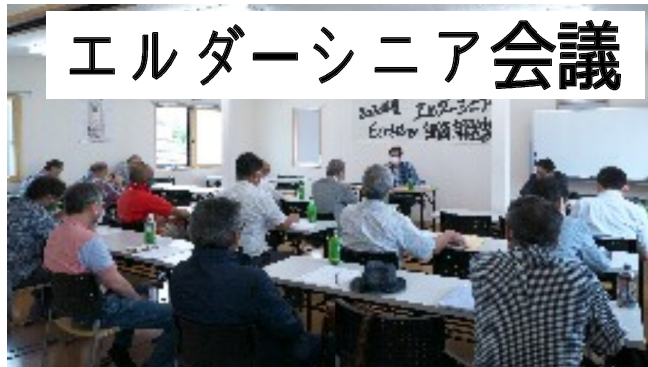
エルダーシニア会議