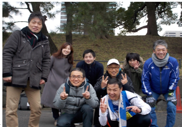
エリアマラソン大会