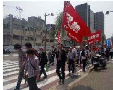
開催企画内容について 屋外集