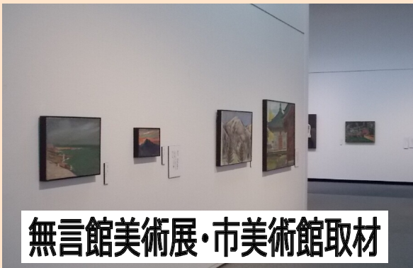
無言館美術展・市美術館取材