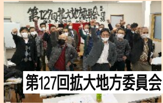
第127回拡大地方委員会