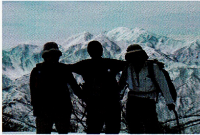
白山山頂からバックに粟ヶ岳 1293 m