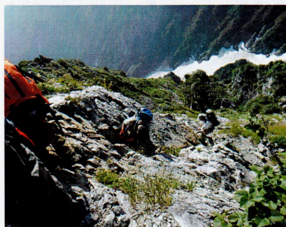
不帰ノ嶮長い鎖場

6:47分南峰に着いたところで小休止(朝食)をする今のところ危険な箇所もなく順調です。南峰をあとにして北峰に向かうとやはり北峰から先に難所がある。足場の悪い岩場の道が幾つかあったが鎖もあるので焦らず行けば問題は無い。不帰ノ嶮I