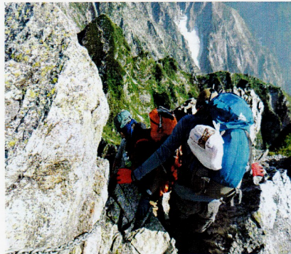
北峰から先に難所、足場の悪い岩場

翌朝早立ちし、山荘正面には雄大な嶮・立山連峰が連なり、約20分で唐松岳山頂に立つ。不帰ノ嶮のゴツゴツとした山並みが目に入る。