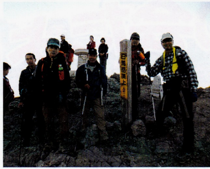
白馬岳山頂 (2932 m)

早立ち5時前、すっかり回復大湊さん「ポカリ」十分、天候もここ一番で、ご来光を観るため急いで山頂へ、大勢の人垣で、写真を撮るのも順番