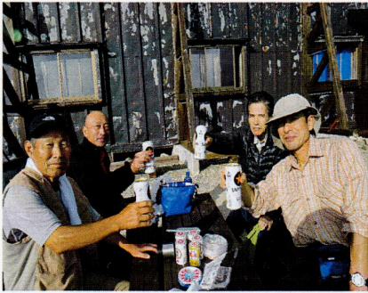
白馬山荘テラス すでに体調が悪そう

ここから白馬鍾ヶ岳、杓子岳へ向かう。稜線から白馬大雪渓を見下ろすとさすがに人気の山。白馬岳を目指す登山者が蟻の行列さながら登ってくる。いったい何人の登山者が白馬岳を目指すのだろう。鍾ヶ岳から白