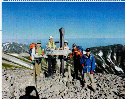
小蓮華山 (2766 m)

…昭和大学は1931 (昭和6) 年、この白馬山荘の前身である白馬山頂小屋に夏山診療所「白馬診療所」を開設した。以来、今年で82年を迎えるこの診療所では、高山病を中心とするさまざまな病気やけがによって、年間400人以上の登山者が手当を受ける。昭和大学白馬診療部 (部員：医学部学生67名) の学生が交代で医師、看護師らの診療活動をサポートしている。