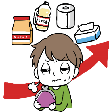
(帝国データバンクより抜粋)